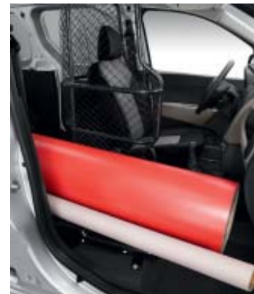
Easy Seat removido.