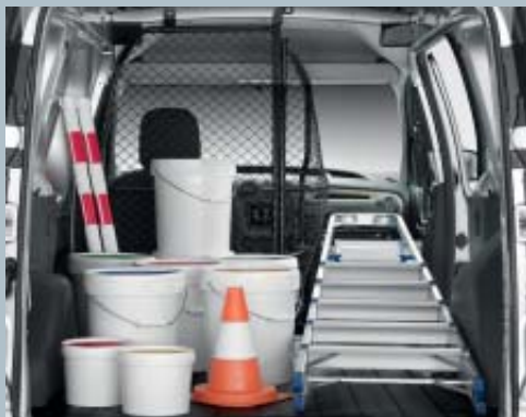
Divisória em rede basculante.