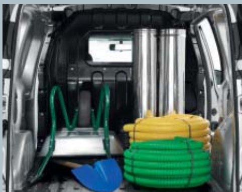
Divisória completa vidrada.