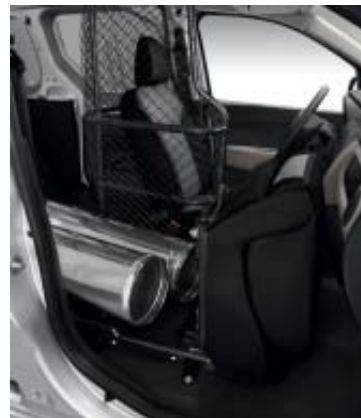
Easy Seat rebatido.