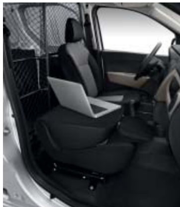
Easy Seat na posição de mesa.

Para aumentar ainda mais a capacidade de carga, o Dokker Van propõe um banco do passageiro multifunção inédito e muito astucioso, o Dacia Easy Seat, totalmente amovível. Uma vez retirado do seu lugar, o comprimento da zona de carga aumenta de 1,9 m para 3,11 m, enquanto o volume útil passa de de 3,3 m 3 para 3,9m 3 . E, com o encosto rebatido, o seu Dokker Van pode transformar-se num prático escritório itinerante. Decididamente, pode pedir-lhe mesmo tudo!